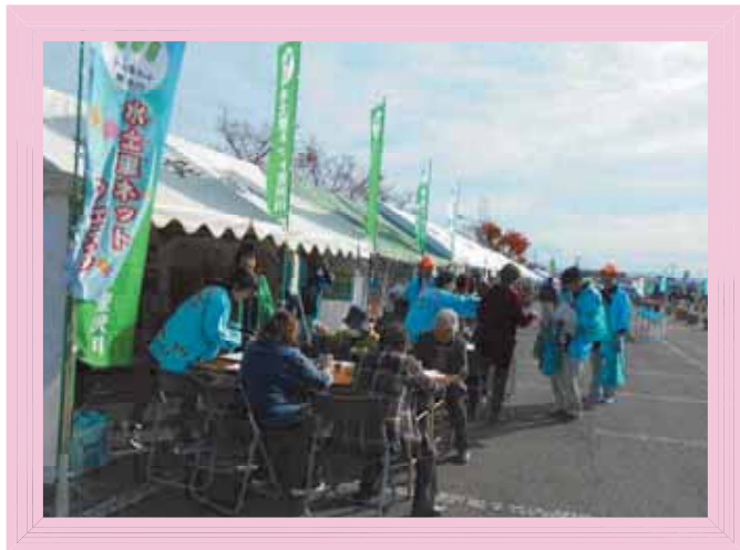
会場アンケート風景

JAいわて花巻主催の農業まつりに、市内4土地改良区、東北農政局和賀中央農業水利事業所と共同で水土里ネットフェスタを行い、土地改良区等関連事業のPR活動を実施しました。2日間アンケートを実施した結果、延1,930名からご回答いただきました。ご協力ありがとうございました。