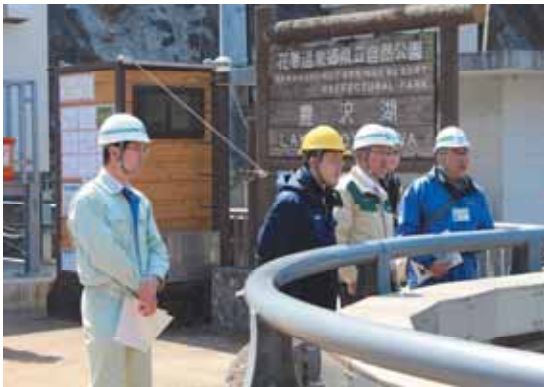
豊沢ダムの視察を行う藤原たかし衆議院議員（左から二人目）と川村伸浩県議会議員（左から三人目）