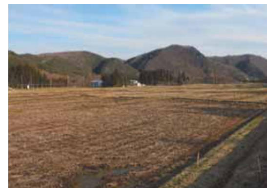
経営体育成基盤整備事業 大沢地区