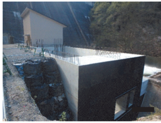
放流施設上屋(奥) 工事中の発電下部工(手前)