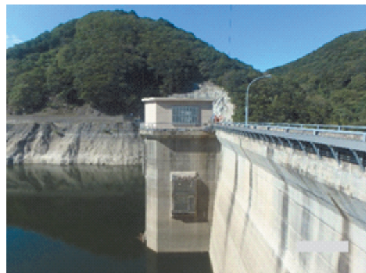
改修後の取水施設