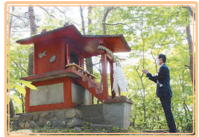
淡島神社降雨祈願

今年は降雨が適度にありダムの貯水も平年並みに確保でき、当初の用水計画に基づく通水管理を行ってきましたが、今後も天候に恵まれるよう、ダム湖畔の淡島神社において神事を執り行いました。