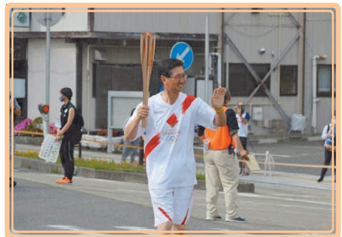
聖火リレーの様子