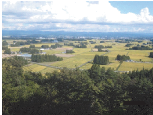
地区内の田園風景

これからも、これら施策に基づきながら事業を進めるとともに、安全に留意し、事業効果の早期発現を目指して工事を進めて参りますので皆様のご支援を賜りますようお願い申し上げます。