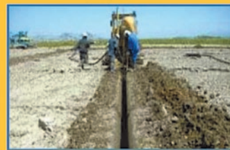
畦畔除去で区画拡大