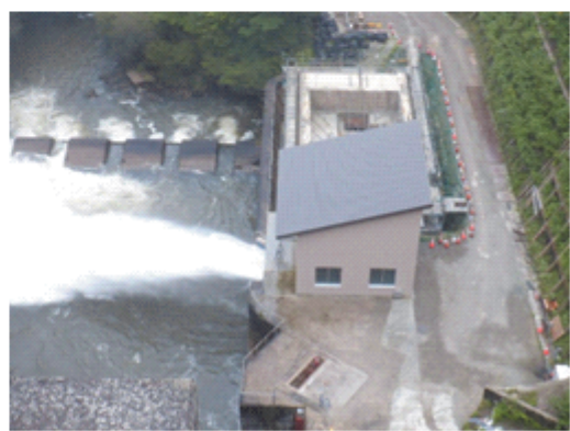
改修後の放流ゲートからの放水状況