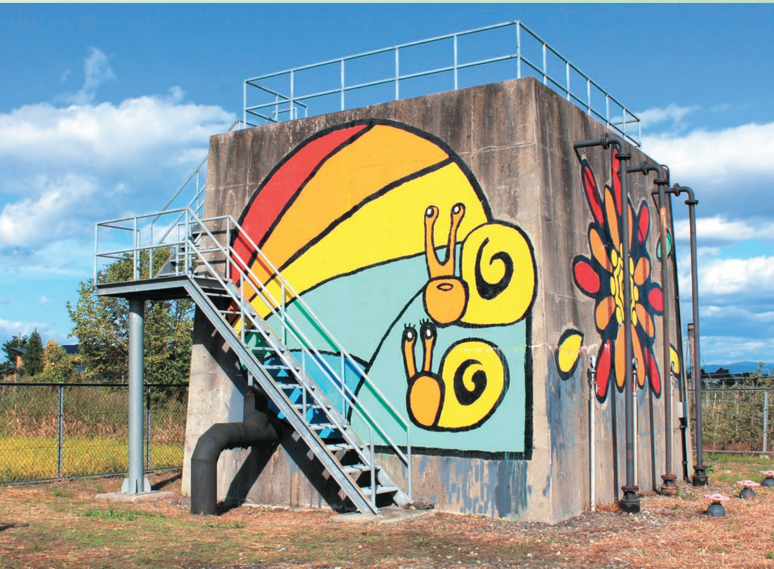
壁画の塗り直しが行われた太田4号配水槽

地区面積：4,997 ha 組合員数：3,833 名 (令和3年4月1日 現在)