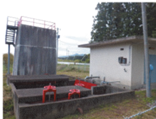
北湯口1揚水機(北湯口地内)