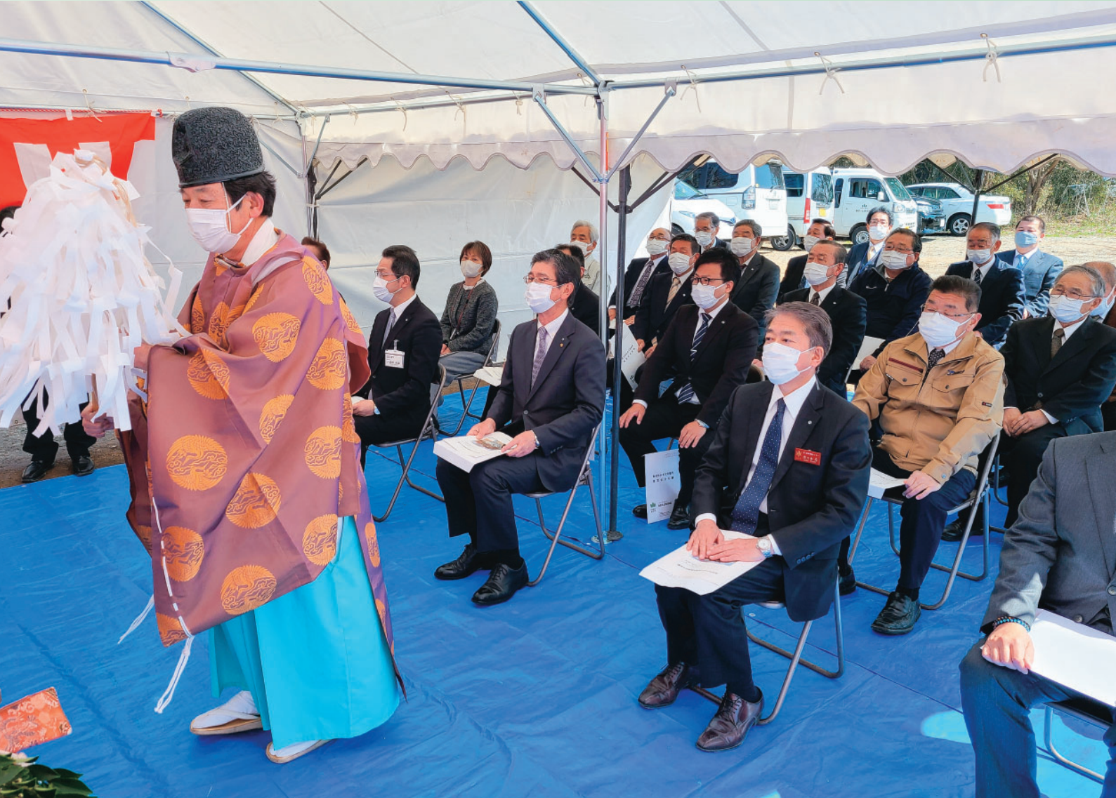
北幹線水路を利用した松沢川小水力発電所操業安全祈願（湯口字蟹沢地内）

地区面積：4,998 ha 組合員数：3,174 名 (令和5年4月1日 現在)