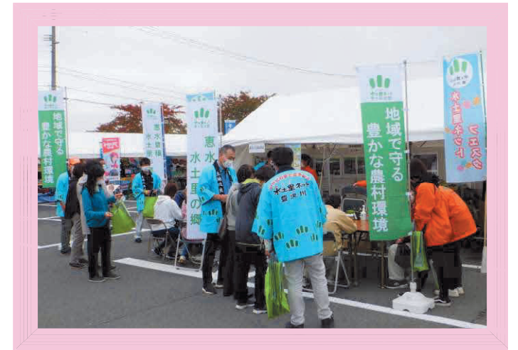
水土里ネットフェスタ