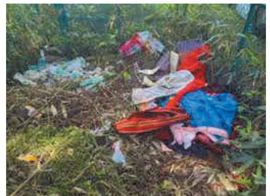
不法投棄（北湯口地内水路）