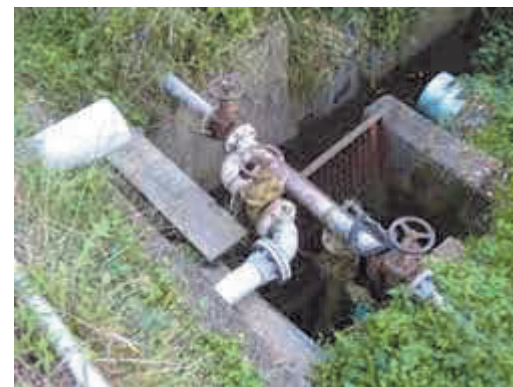
照井揚水機(東十二丁目地内)