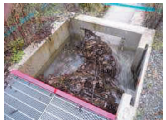
ゴミ詰りにより上流部越流

事故が発生すると、補修作業に伴い近隣エリアが断水となります。農作業前に給水栓の位置を確認し、目印を立てるなどの対策をお願いします。