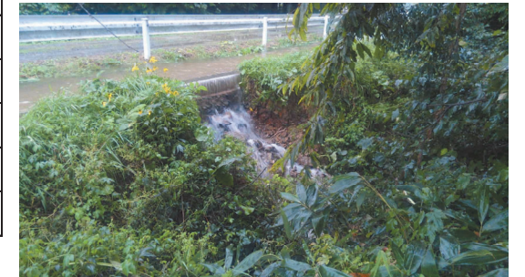
早期事業完了が望まれる北湯口線水路 ※降雨による水路法面崩壊