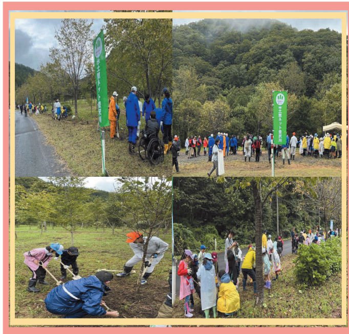
豊沢川の森植樹祭