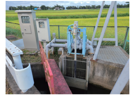
木本堰揚水機（水中ポンプ更新 他）