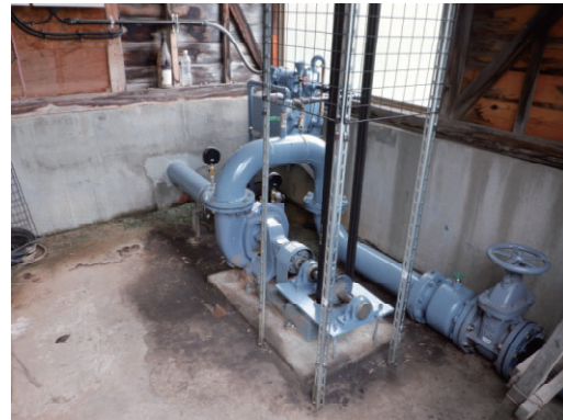
後河原揚水機（主ポンプ整備 他）