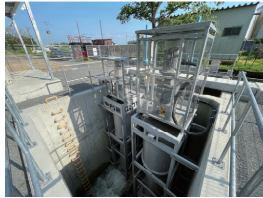
松沢川小水力発電所（発電機）